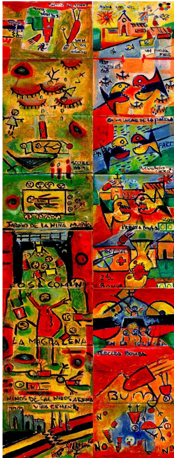
BOJAYA NO MAS OBRA GRAFICA DIPTICO 50X 175 CENTIMETROS CASA MARA SEDE CULTURAL URABA COLOMBIA 2012.