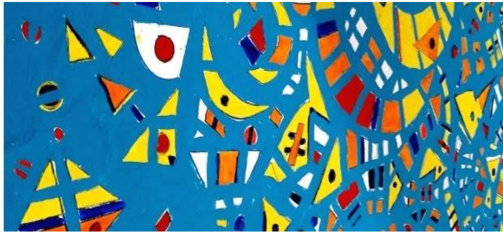
PECES Y LUNAS ACRILICO SOBRE LIENZO 4.20X2 METROS CASA MARA SEDE CULTURAL Apartadó Colombia 2018

Gli alberi nidificano i pulcini La sua corteccia si spezza, Sono rimasti senza linfa, I suoi fiori si diffondono Per essere superato A causa del freddo autunnale Li ha inesorabilmente azzittiti per sempre.